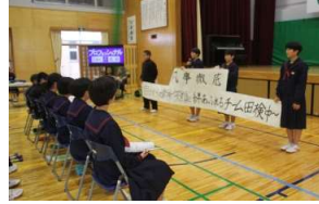
みんなで生徒会を盛り上げよう！