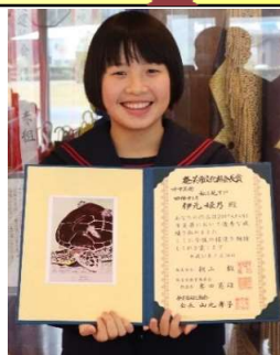
奄美市文化協会長賞 「私を見て」

また部活動の方も頑張っています。保護者の皆様、大会等の生徒送迎等いつもありがとうございます！