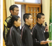
生徒が進行します