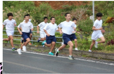
スタートの様子です