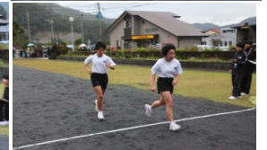
ゴールの様子です。みんな頑張りました！