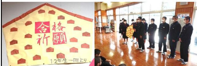
3年生への激励メッセージ